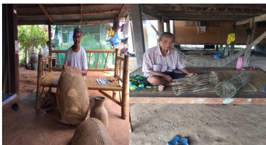
ด้านสมุนไพร

ภูมิปัญญาด้านสมุนไพรไทยเป็นมรดกทางวัฒนธรรมที่สืบทอดจากรุ่นสู่รุ่นเน้นการใช้พืชพรรณในท้องถิ่นมาเป็นยาและอาหาร (กินพืชเป็นยา) เพื่อรักษาโรคและดูแลสุขภาพเช่น การใช้ขมิ้นชันและโพลีในลูกประคบเพื่อลดอาการปวด หรือสมุนไพรพื้นบ้าน เช่น ฟ้าทะลายโจร ชิง และกระชาย ที่